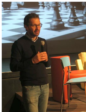
Der Gruß von BM Griessmair