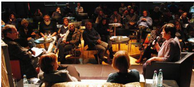
Information schafft die Grundlage für Kooperation