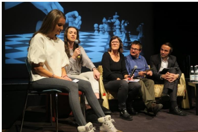
Präsentation und Austausch mit LR Philipp Achammer (2017)