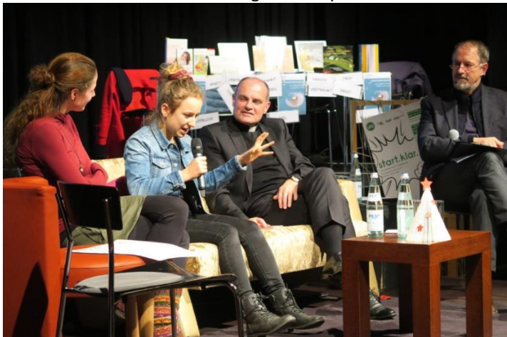
Auch Bischof Muser ist gekommen, um zuzuhören und sich über das Engagement der Menschen zu freuen (2018)

Nutzen Sie diese Gelegenheit und stellen Sie uns Ihre Projekte und Initiativen mit Hilfe des beiliegenden Formulars kurz vor. Eine Arbeitsgruppe wird die Bewerbungen sichten und mit Ihnen in Kontakt treten, um alles weitere zu klären.