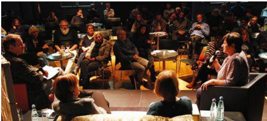
Information schafft die Grundlage für Kooperation

Nutzen Sie diese Gelegenheit und stellen Sie uns Ihre Projekte und Initiativen mit Hilfe des beiliegenden Formulars kurz vor. Eine Arbeitsgruppe wird die Bewerbungen sichten und mit Ihnen in Kontakt treten, um alles weitere zu klären.