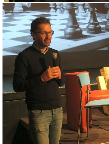
Der Gruß von BM Griessmair